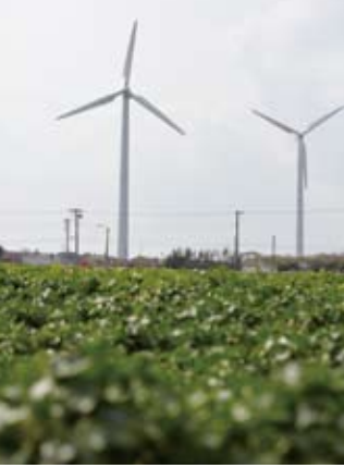
宮川公園の風車。平成9年に設置され、経済産業省の研究対象として、発電データが収集されている。