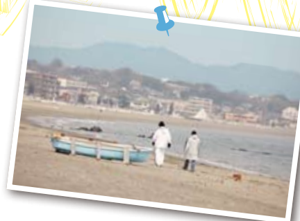
金田湾に面する菊名海岸は、三浦海岸の南に伸びるビーチ。緩やかな曲線が続く砂浜は散歩に最適。

銀幕の中で恋人たちが愛を語らう海岸、学園ドラマの教室風景……。これらはどこで撮影されているのだろうか? 映