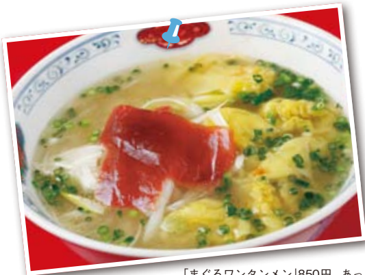
「まぐろワンタンメン」850円。あっさり味の塩スープに、マグロのワンタンと赤身の漬けがのる。